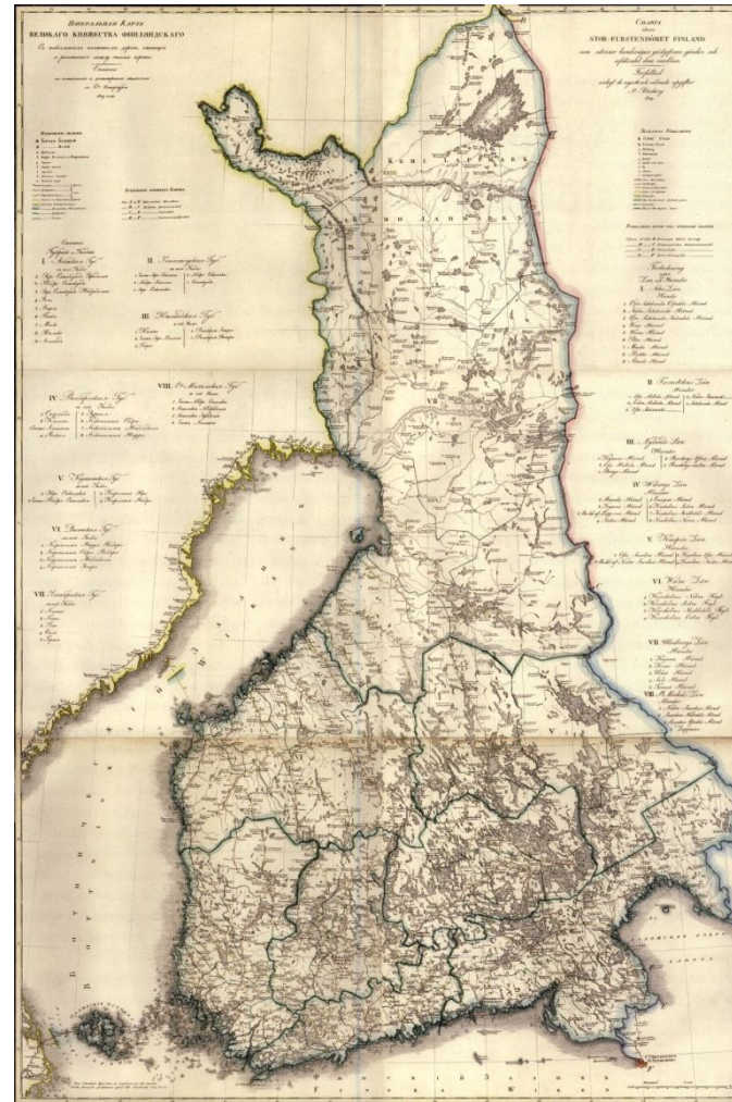
Suomen suuriruhtinaskunta 1812-1917